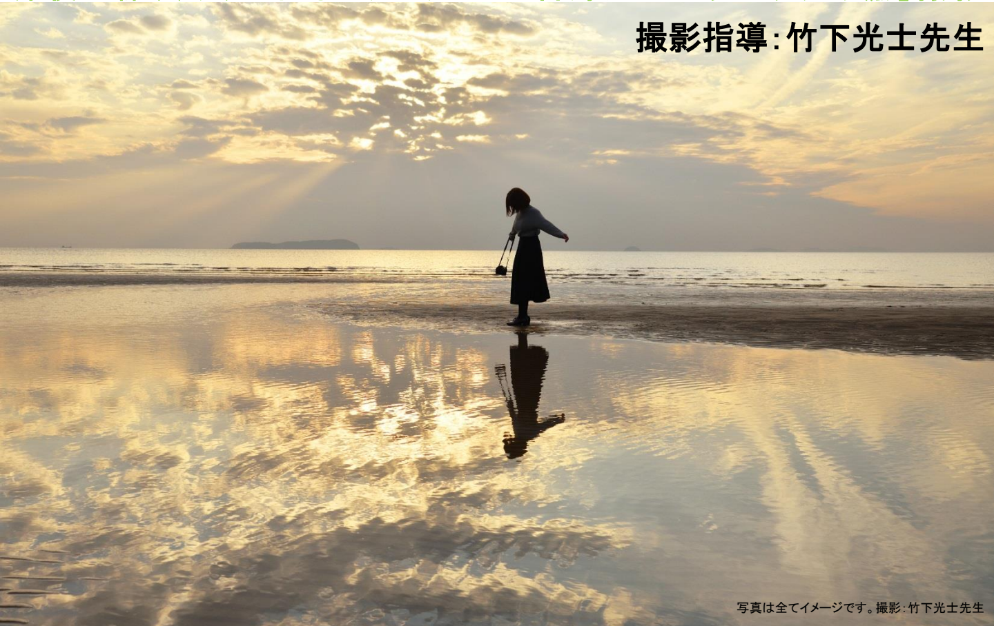
写真は全てイメージです。